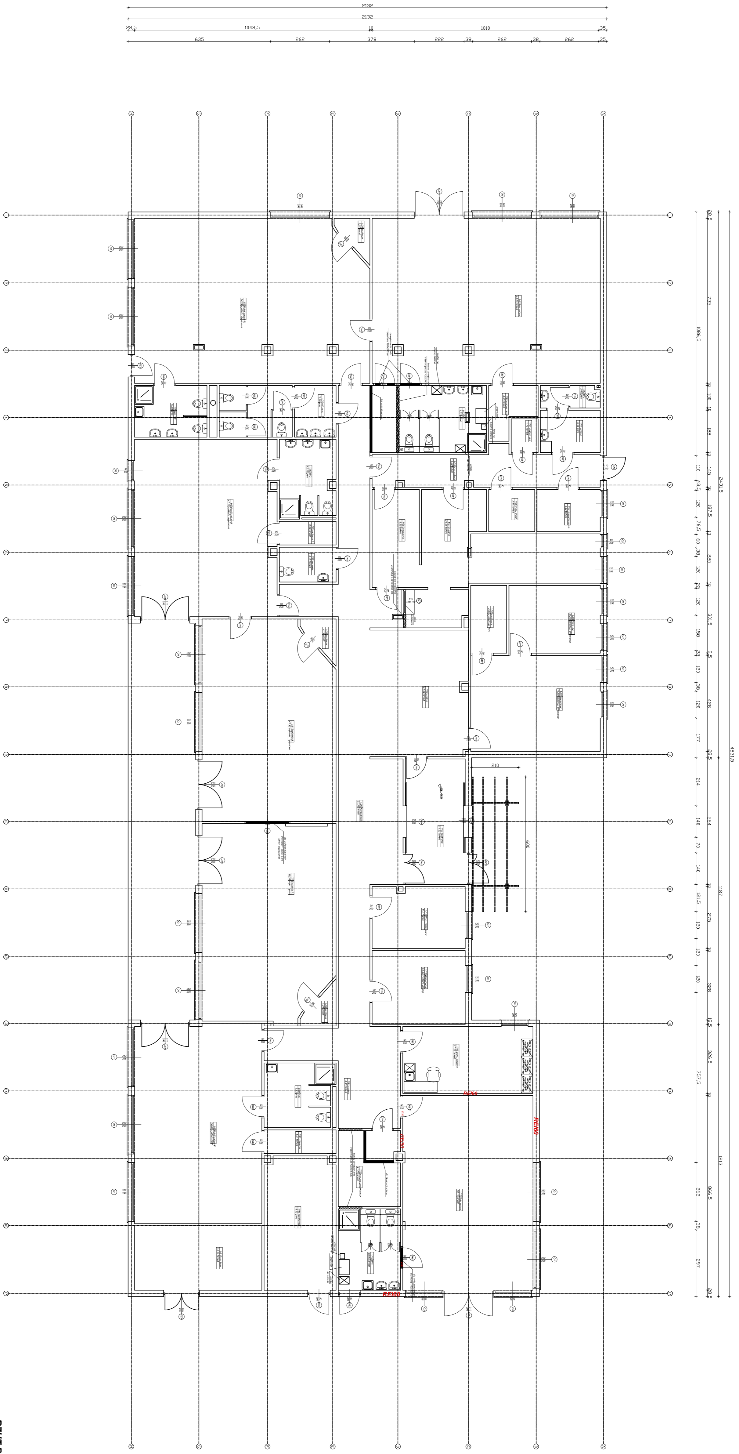
RZUT PARTENERU 1:100

STANOWISZCZYNIA STANOWISZCZYNIA STANOWISZCZYNIA STANOWISZCZYNIA